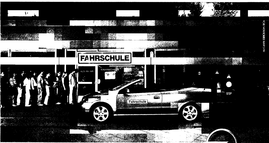
MICANN BRICKSON BGA

MF: Hierzu muss man wissen, dass sich die Fahrschule den bzw. die Lkw mit anderen Fahrschulen teilt. Das führte dazu, dass ich immer 3 bis 5 Fahrstunden an einem Vormittag hatte. Ich bin meine 26 Fahrstunden daher an insgesamt nur 7 Tagen gefahren. Das Problem einer solchen Kompaktausbildung sehe ich in einem Mangel an Festigung und Wiederholung. Ich wurde punktgenau für die Prüfungen ausgebildet. Zum Beispiel habe ich die Abfahrtskontrollen nur einmal, nämlich am Tag vor der Prüfung, kennen gelernt. Das Gleiche gilt für die Grundfahraufgaben.